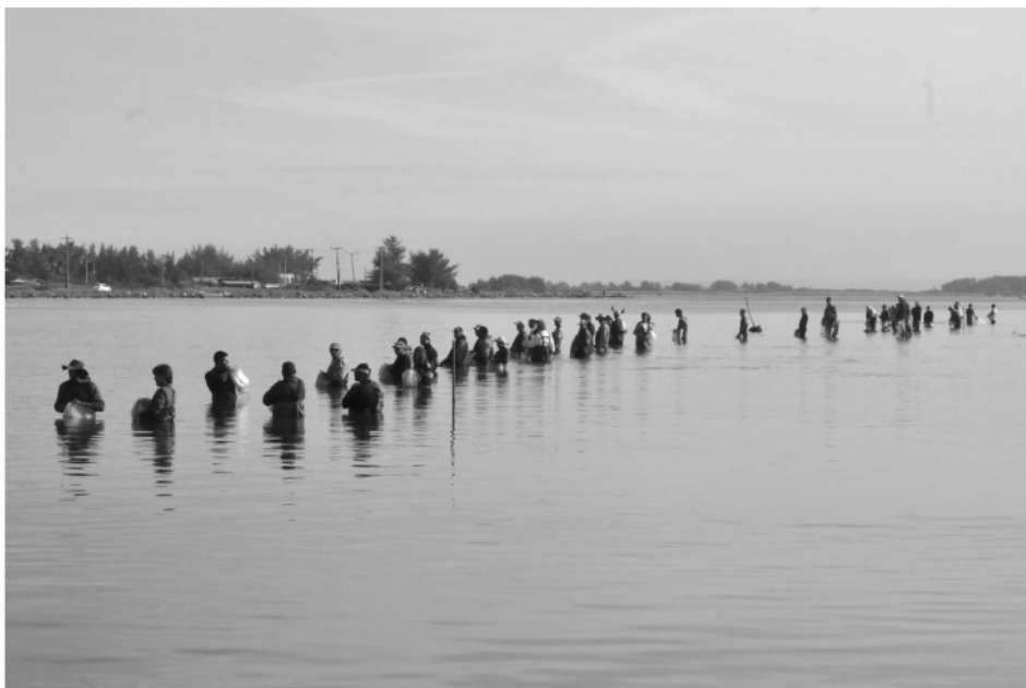
Figura 3 – Pescadores na linha d'água (inverno 2016).

a Tesoura diversas vezes em um único dia, as jornadas e a espera dos pescadores podem ser extenuantes. Fora d'água, outros homens limpam e vendem peixes, fazem e reparam as tarrafas, esperando a vez de fazer a vaga , que são as posições dentro d'água, ocupadas por ordem de chegada.