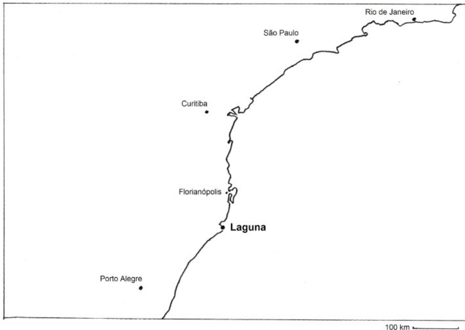
Figura 1 – Localização de Laguna. Mapa: Gabriel Coutinho Barbosa