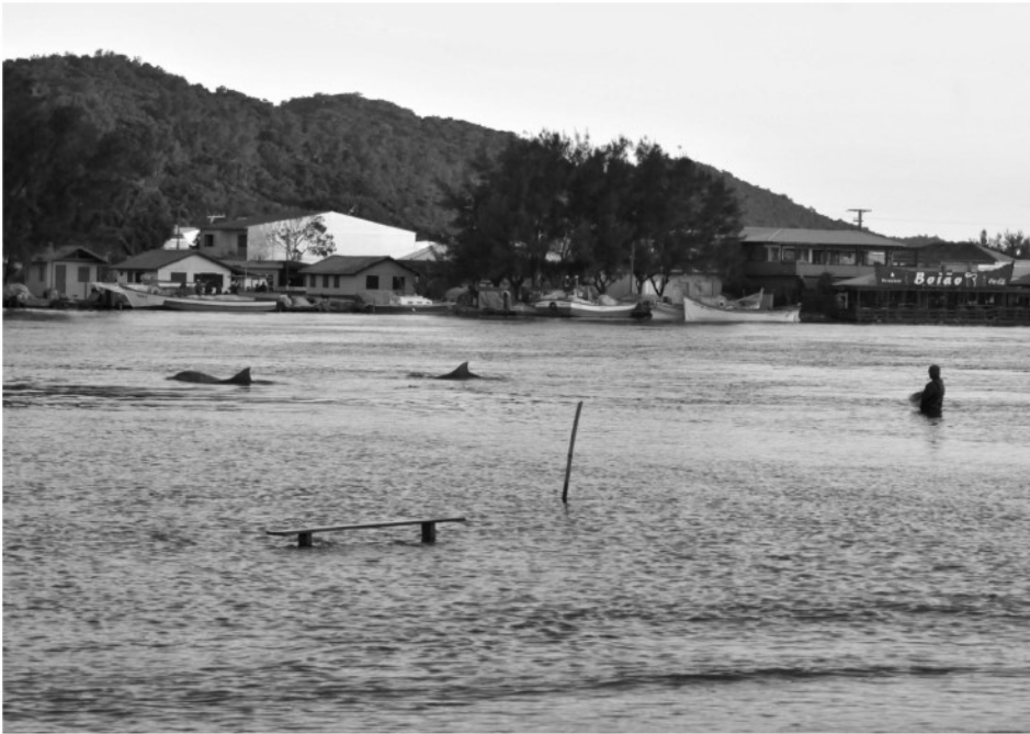
Figura 6 – Fim de tarde na Tesoura (inverno 2016).