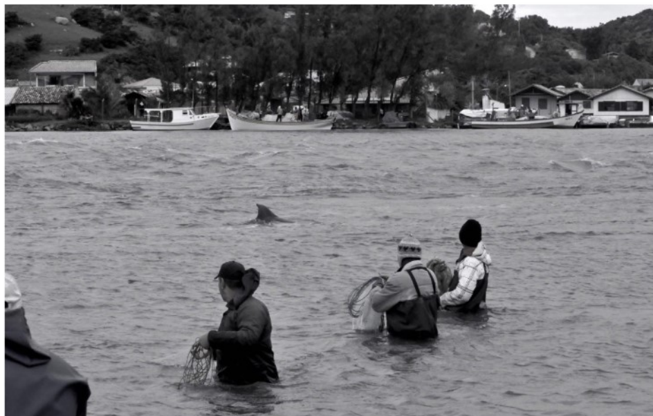
Figura 4 – Um(a) boto(a) se aproxima (inverno 2016).

É o momento tão esperado, quando os homens devem arremessar suas redes. O primeiro a fazê-lo é aquele na vaga em frente à sinalização do animal. Em seguida, é a vez daqueles que estão imediatamente ao seu lado lançarem as tarrafas de fora ou do recurso . Cada sinalização de um golfinho desencadeia uma sequência de movimentos quase coreografados de torções de troncos e estiramentos de braços para arremesso das tarrafas.